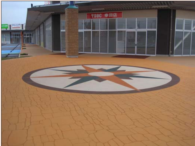
◀ エントランス広場

今回ご紹介する現場は、愛知県額田郡幸田にあります。『カメラガーデン幸田2』。施工面積 約1,420㎡のストリートフrintの現場です。エントランスと通路部分に採用されました。