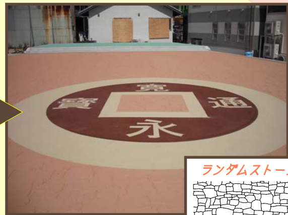
ランダムストーン