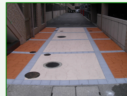
西本建設株式会社 様