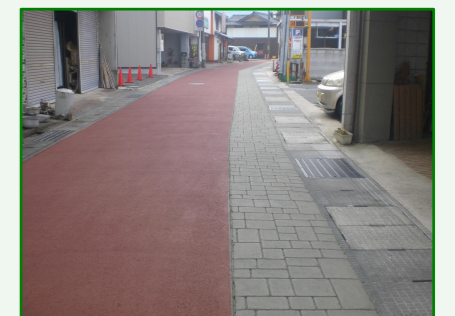
株式会社アトライナー 様