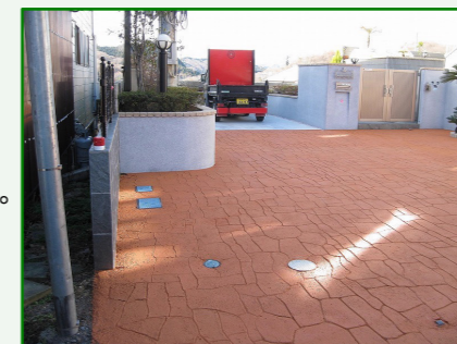
有限会社サワケン 様