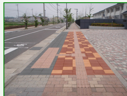
笠原建設株式会社 様