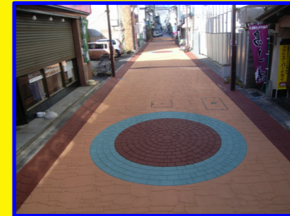
丸浜舗道株式会社 様