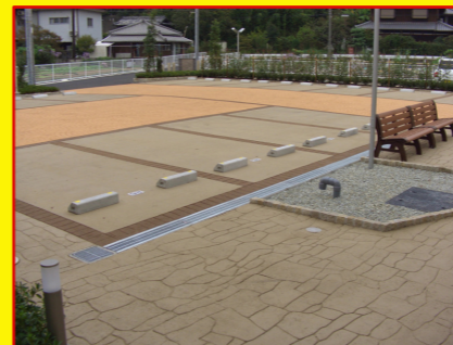
株式会社三豊工業 様