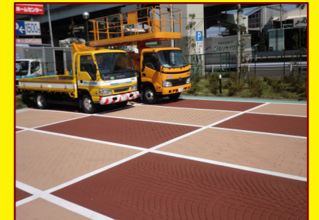
ニシオレントオール神奈川株式会社 様