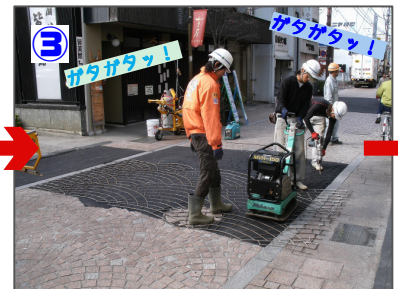
3 型押し 適切な温度まで上昇した箇所にテンプレートを配置しプレートコンパクターでプリント作業を行います。