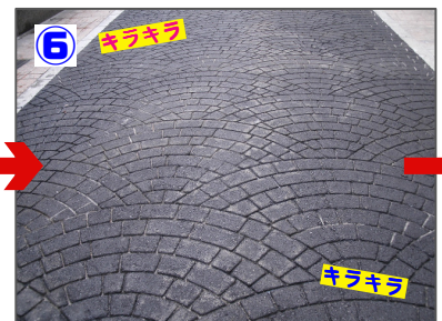
6 スチールテンプレート除去 アスファルトにしっかりと型が押し込まれたらテンプレートを取り外します。