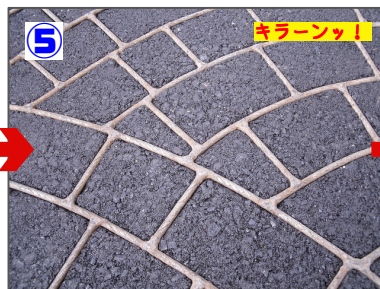
5 型押し おお～美しい！！ テンプレートがしっかりと入りこんでいます！