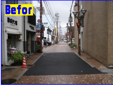
Before インターロッキングの補修によって、アスファルト舗装になった部分が8ヶ所程あり、同色系・同系型でストリートプリントを施工いたしました。

今回のトミ通は、元請け様のT社 H様より、ナイス☆ショットな写真をたくさんいただきましたので、ストリートプリントの施工をご覧になったことがない方の為に、写真に沿って施工工程をご紹介させていただきますっ！ 継ぎ接ぎだらけだった車道が、こんなに素敵な仕上がりにになりました。 時代は、ストリートプリントですっ☆☆☆ 是非ともトミナガコーポレーションにご一報をっ！！