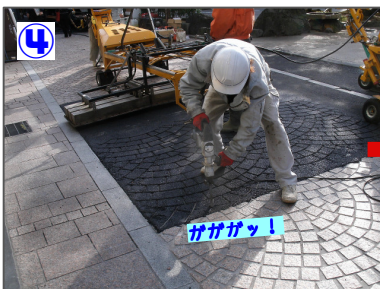
4 型押し(目地処理) 端などコンパクターで作業できない箇所は、手作業です。