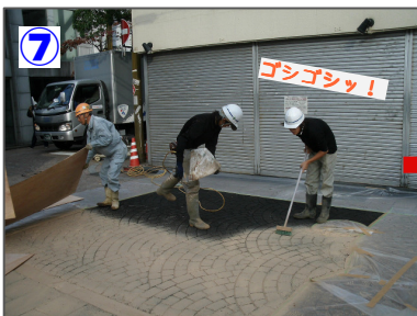
7 ストリートボンド着色(吹付け) 1回目着色