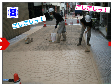
8 ストリートボンド着色 2回目着色