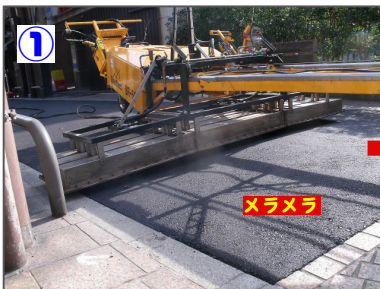
1 アスファルト加熱 ストリートヒートで路面を140℃～160度まで加熱します。