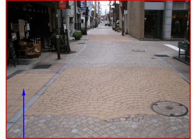
パターン：ストーンペイブ カラー：ファウン