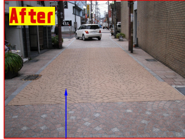
After パターン：スキャロップ カラー：ファウン