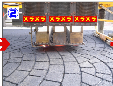
2 アスファルト加熱 アツアツです！この再加熱により、アスファルトが柔らかくなります。