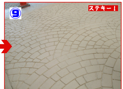
9 施工完了 ストリートボンド塗り付け2回～3回で仕上がります。軽歩行なら短時間で交通解放が可能です！