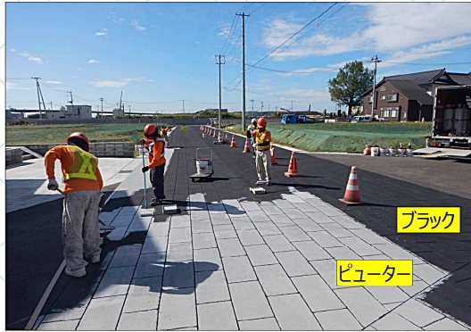
↑ 表層のカラーを着色中