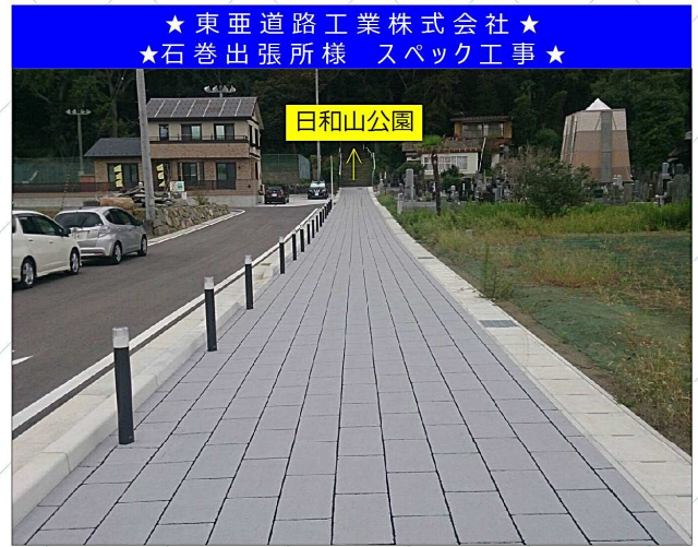
↑ 日和山公園へと続く避難通路

【パターン】 ストーンパイプ 【カラー】 ピューター(表層) ブラック (目地)