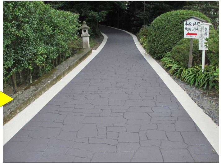
仕様：ランダムスレート（グラニート）