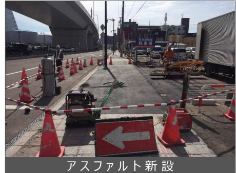
アスファルト新設