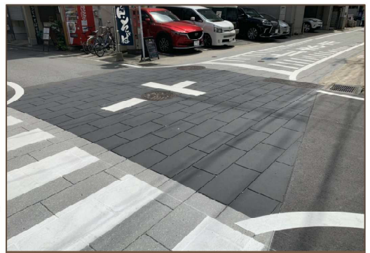
交差点前のカラーを变えることにより、視認性が向上します！

博多の歴史や文化を生かした街並みづくりを進める 福岡市の【博多旧市街プロジェクト】の一環で、「本物の石畳では山笠（ヤマ）が動かしにくい…」「でもアスファルトだと景観が…」という住民の声から、ストリートプリントをご採用いただきました！