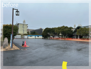
土・河川・水田跡をイメージした歴史的景観に調和したデザイン